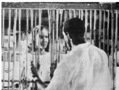
À esquerda, Orfeu do Carnaval, filme que adaptou Orfeu da Conceição (de Vinícius de Moraes). À direita, Carlos Lyra e Nara Leão, no início da bossa nova.

Exemplo disso é a bossa nova , uma revolucionária mistura de jazz com samba e música clássica, que revelou ao mundo grandes nomes da música brasileira como Vinícius de Moraes, Tom Jobim, João Gilberto, Carlos Lyra, Ronaldo Bôscoli, entre outros. O novo estilo, considerado inicialmente um ritmo sofisticado demais, impôs-se pelo talento de seus compositores e intérpretes que cantavam acompanhados apenas de violão.